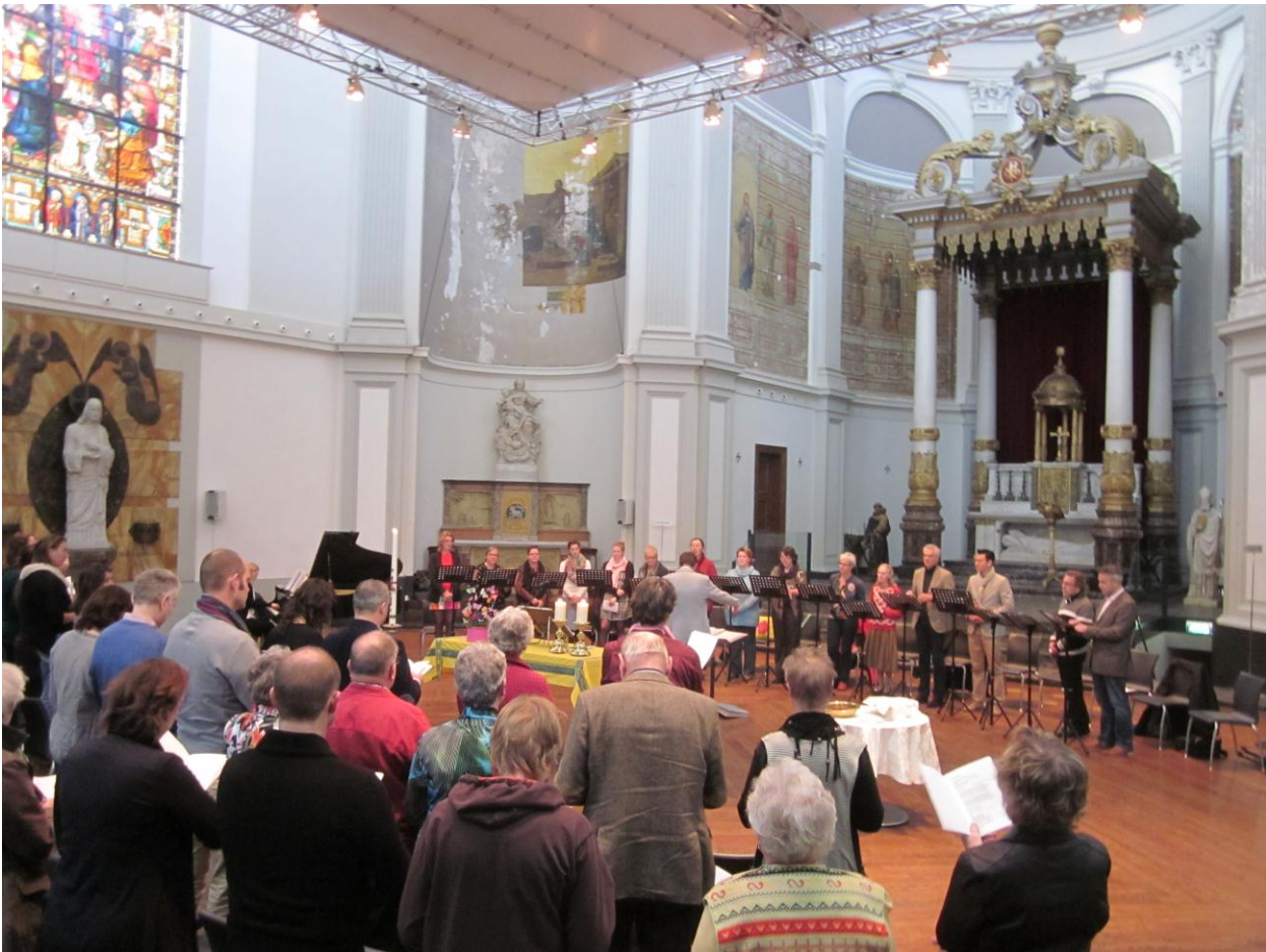
Gemeente en koor van De Duif