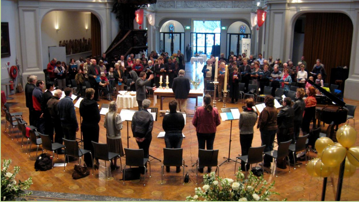
Koor en gemeente De Duif

“Telkens ben ik weer verrast, mijn religieuze kaders worden opgerekt”