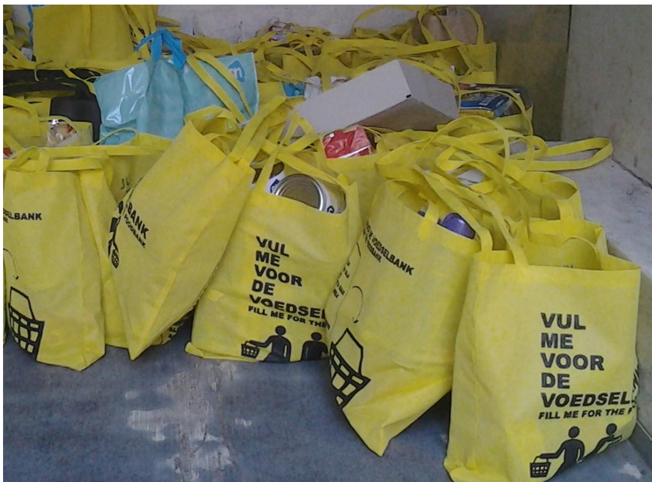
11 November: St. Maarten. Duiven en buurtgenoten brengen gevulde tassen voor de Voedselbank

We kijken terug op een geslaagd jaardoel.