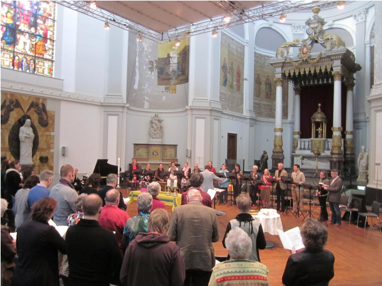
Gemeente en koor van De Duif