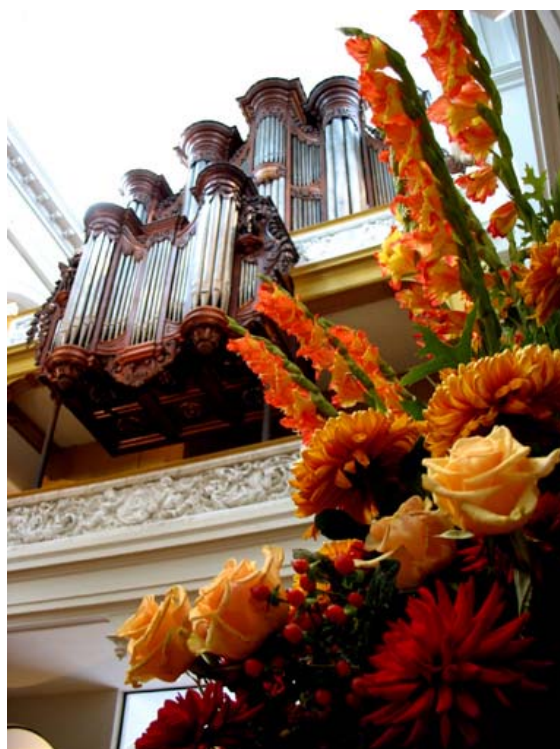
Op 25 september 2006 werd het gerestaureerde Smits orgel feestelijk opnieuw in gebruik genomen.