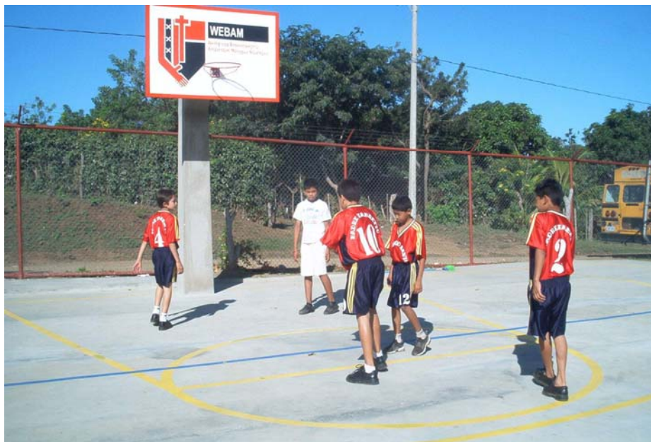
Basketballveld in Nicaragua, gesponsord door de WEBAM.

In 2006 werd er maandelijks voor de Webam gecollecteerd. De Duif heeft met andere basissgemeenten in Amsterdam een goede band met de kerk in Nicaragua en wij steunen gezamenlijk diverse projecten aldaar. Onze bijdrage in 2006 was: € 825,69.