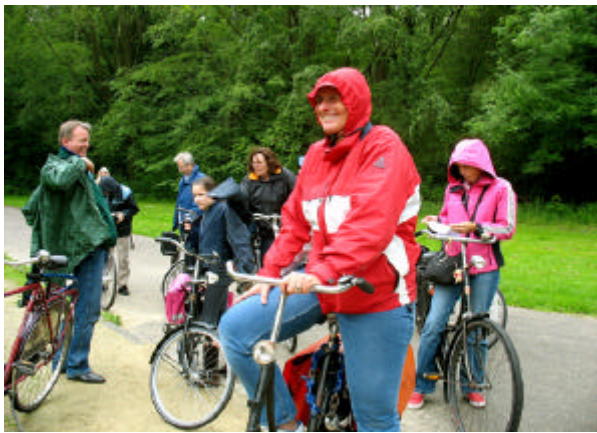
fietstocht met Pinksteren