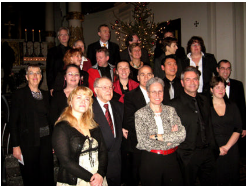
Groot Duifkoor, Kerstavond 2007

Ook in 2007 zagen we een lichte stijging van het gemiddeld aantal bezoekers per viering. Opnieuw bleek dat ook vooral de thematische vieringen goed werden bezocht; met name zijn we tevreden over een groeiend aantal bezoekers voor de zomerserie. Deze serie betrof een 7-tal vieringen rondom het centrale thema: Een Psalmen Symphonie, naar de gelijknamige CD met teksten van Huub Oosterhuis op muziek gezet door Antoine Oomen. In deze zomerserie stonden de psalmen 1, 10, 23, 42, 139, 146 en 150 in het middelpunt van de belangstelling.