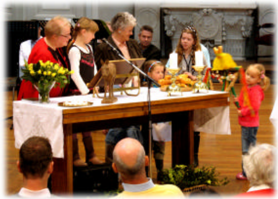
kinderen doen mee met breken en delen