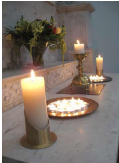
ter nagedachtenis aan hen die ons ontvielen