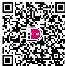
Jaardoel De Duif 2023

Jaarlijks kiest de Duifgemeenschap een zogenoemd “jaardoel”. Elke 2 e zondag per maand wordt gecollecteerd voor dit “externe” doel. Dit jaar is het doel het 50 jarig bestaan van onze gemeenschap. We willen dit met elkaar herdenken en vieren. Ook hiervoor geldt: je bijdrage wordt enorm gewaardeerd.