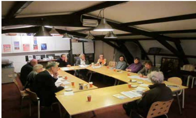
Liturgievergadering op 28 oktober 2013 op 't Hemeltje

Sinds de coronaperiode vergadert de voorbereidingsgroep tweewekelijks via Zoom.