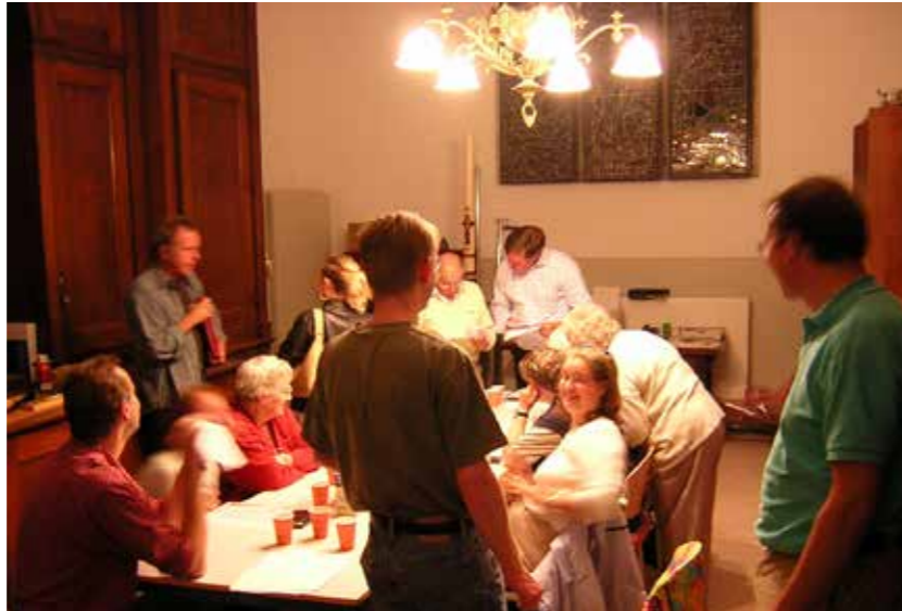
Liturgievergadering op 1 september 2003 in de sacristie