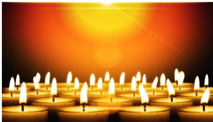
Afbeelding: Pixabay, Geralt