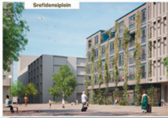
Artist impression van het door woningcoöperatie Stroom ontworpen gebouw.

Het is een stuk stiller als je de hele dag vanuit huis je dingen doet. Vroeger heb ik samengewoond, en nog verder terug woonde ik in een kraakpand. Daar nam ik deel aan dagelijkse eetgroepen en waren er dichtbij dagelijkse contacten. Ik verlang naar zoiets, een eigen stek met allerlei generaties, reuring, je eigen gang gaan en een beetje omkijken naar elkaar. Mijn zoektocht bracht me bij een nieuw fenomeen in Nederland: wooncoöperaties, waarvan er de afgelopen jaren 12 in Amsterdam ontwikkeld zijn of worden. De basis is simpel samengevat: Je bouwt als vereniging je eigen huis en huurt van je eigen vereniging. Ik heb gekozen voor de multigenerationele wooncoöperatie Stroom ( www.wooncooperatiestroom.nl ). Over 2 jaar kan het huis er staan, op Centrumeiland – IJburg Amsterdam, 30 appartementen met gezamenlijke ruimten voor midden-huurprijzen.