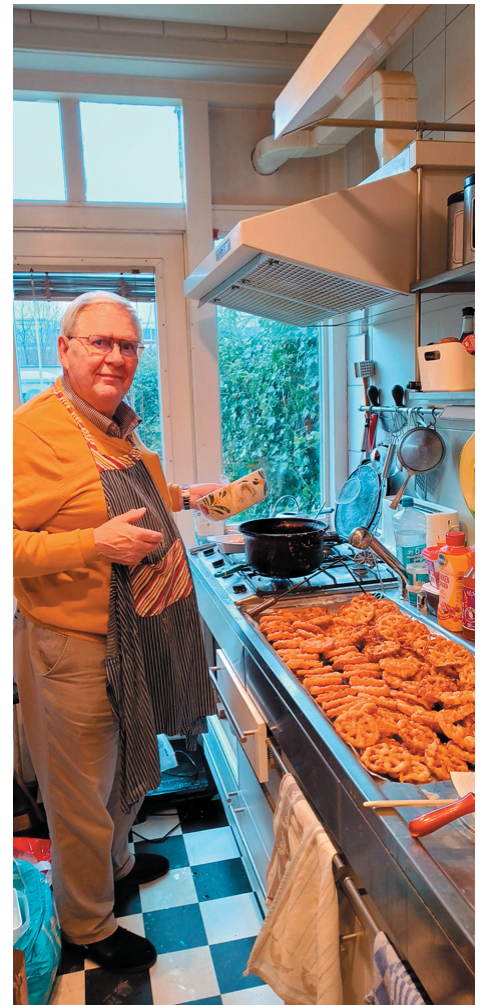
Ton in het domein waar hij de scepter zwaait.